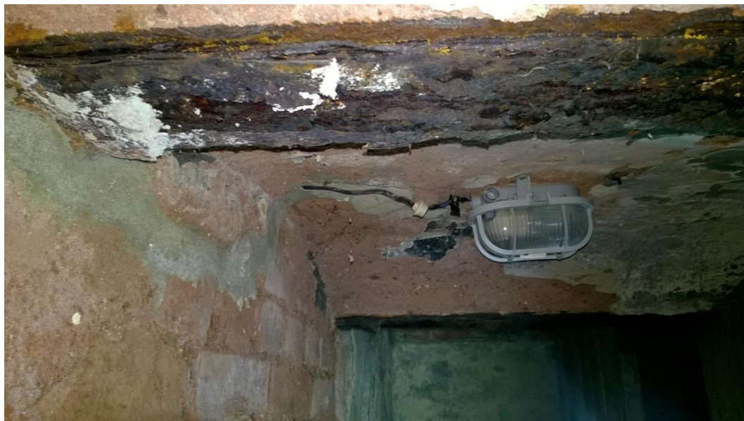
fot. nr 3 skorodowana i rozwarstwiona belka stropowa

Tworzące się produkty korozji są słabo związane z podłożem i ze względu na dużą porowatość nie stanowią bariery ochronnej zapobiegającej dalszemu utlenianiu.