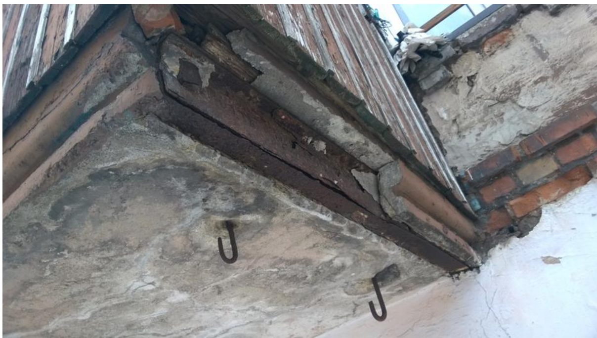
fot. nr 4 całkowicie zniszczona stalowa belka nośna płyty balkonowej

Belki wspornikowe stalowe - ostateczną ocenę belek stalowych będzie można dokonać po pełnym odkuciu całej płyty Skorodowanie belek powyżej 20 % kwalifikuje belki stalowe do wymiany . Od krawędzi zewnętrznej płyty żelbetowej stalowe belki skorodowane i rozwarstwione zarówno środniki jak i stopki.