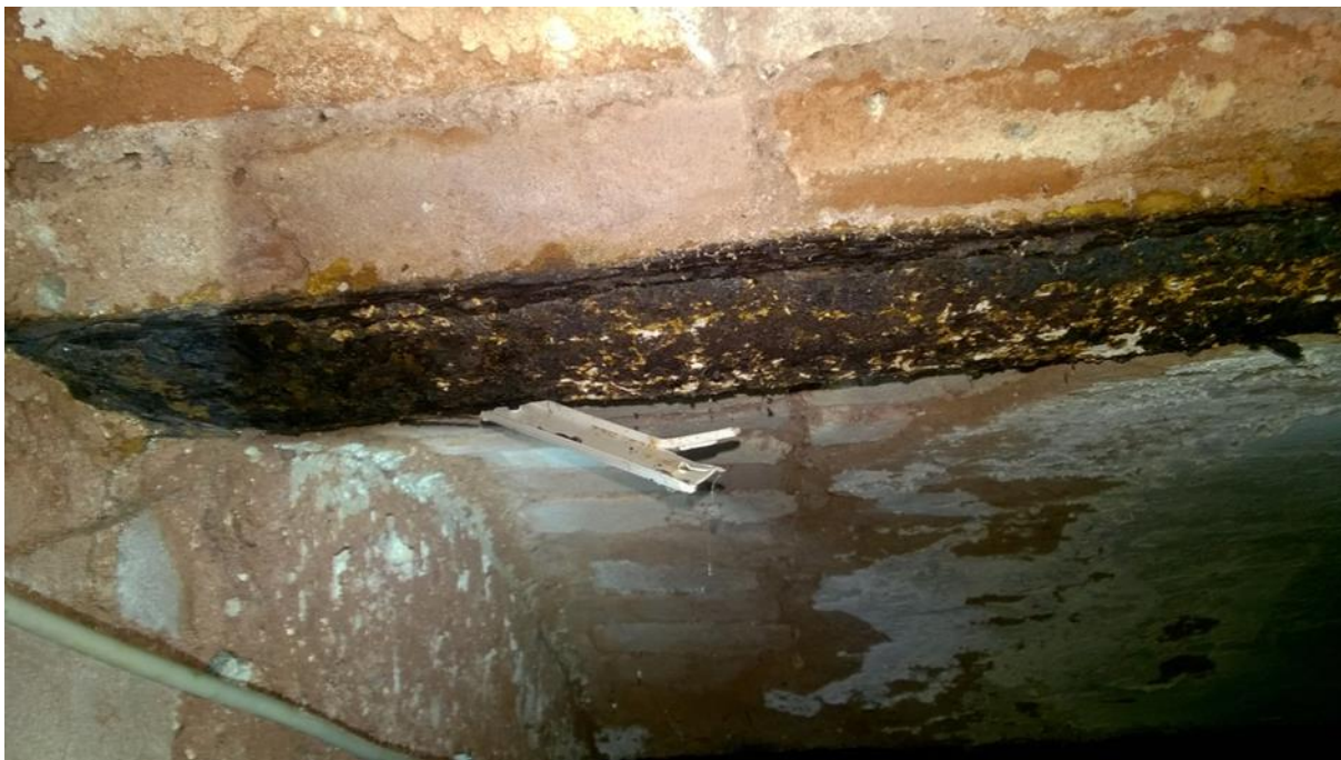
fot. nr 1 korozja powodująca rozwarstwienie dolnych półek belek stropowych - belka w piwnicy na końcu korytarza po lewej stronie

Zwiększony poziom wilgoci w części piwnic przyległych do ściany podłużnej zewnętrznej spowodował korozję elementów stalowych stropów piwnic.