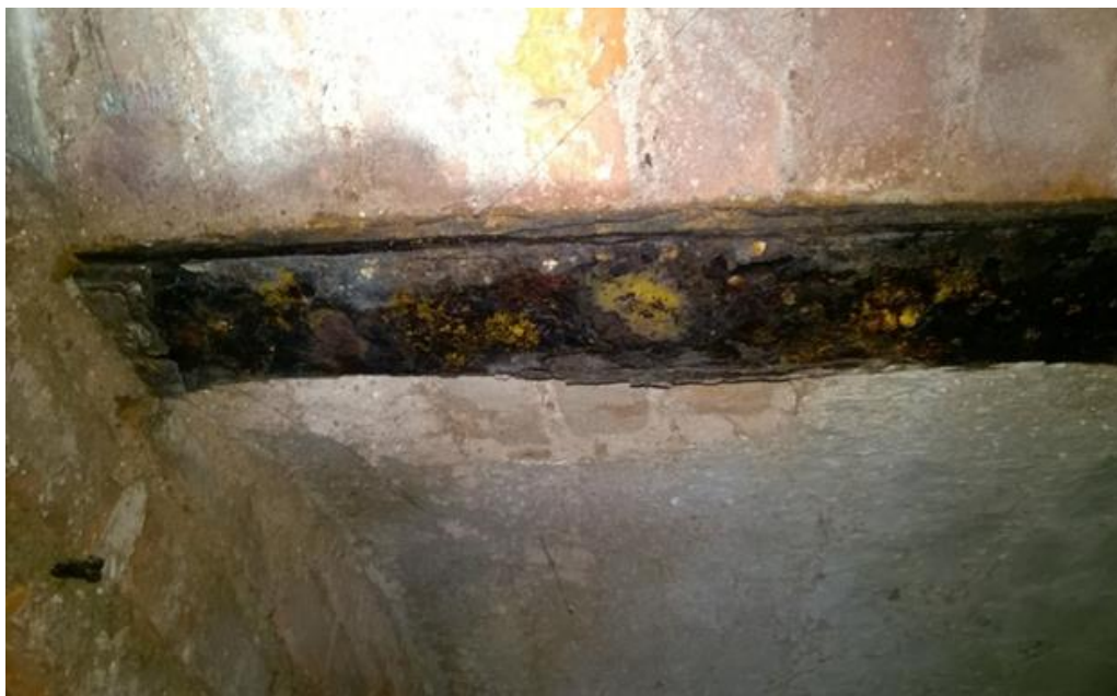
fot. nr 2 korozja ogólna belki stropowej- belka w pomieszczeniu piwnicznym przy schodach po lewej stronie

Silnie skorodowana belka stropowa. Brak ubytki na ceramicznej płycie łukowej stropu oraz na belce stalowej doprowadziło do korozji wgłębnej. Taki rodzaj korozji powoduje całkowite zniszczenie elementu belki.