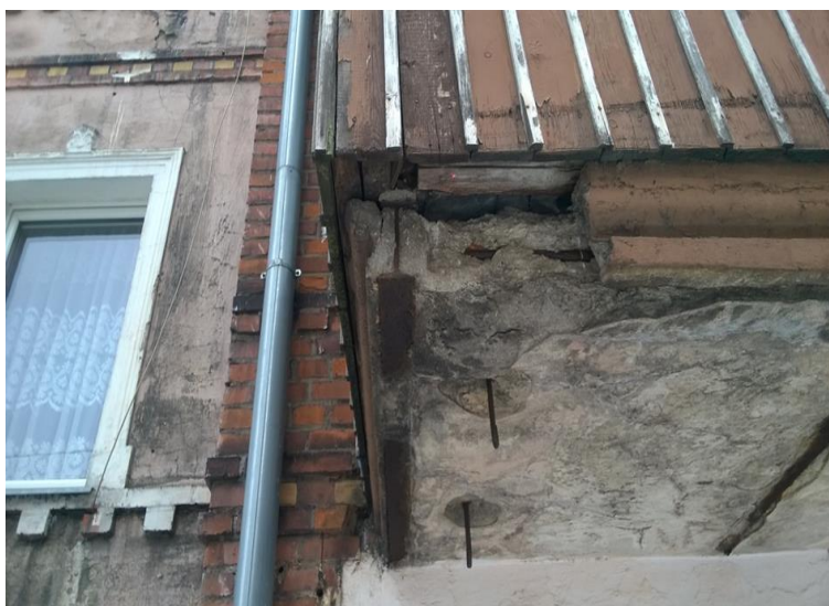
fot. nr 5 zniszczona płyta

Obróbki blacharskie obrzeży płyty balkonowej wykonać z blachy tytan cynk grubości 0,55mm , szerokości min.30 cm. Po wykonaniu płyt balkonowych odtworzona zostanie drewniana obudowa balkonów.